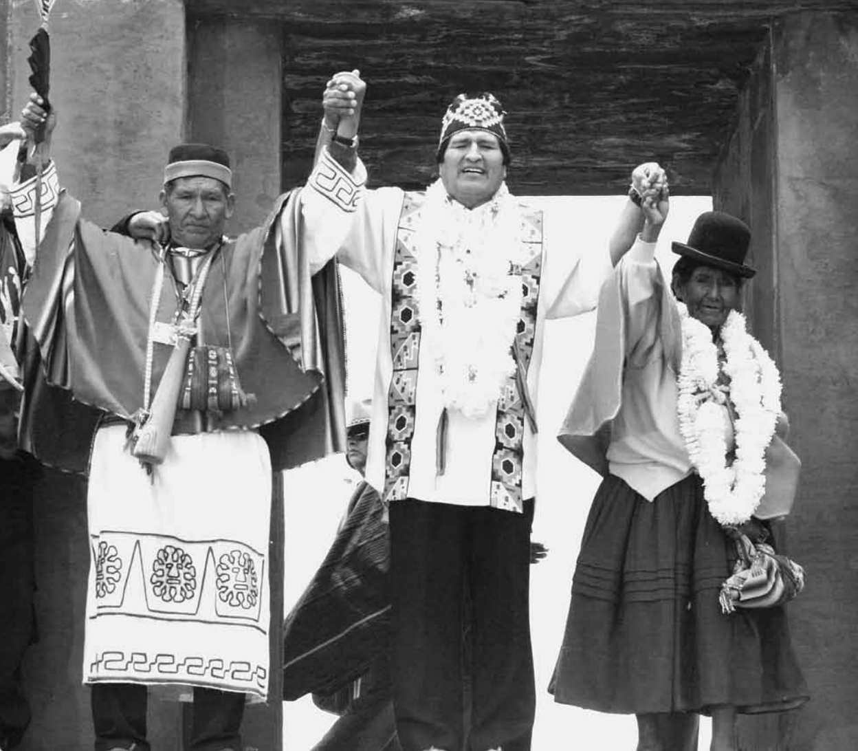
Suma qamaña o vivir bien: evocando el pasado. Algunas sociedades como la boliviana, asocian el buen vivir con la revalorización de tradiciones culturales indígenas.

de su título como pilares que llevarían al vivir bien. Se plantean objetivos valiosos como el ataque a la pobreza, pero se mantiene al extractivismo como motor de la economía, e incluso se postula convertir a la naturaleza en proveedora de excedentes.