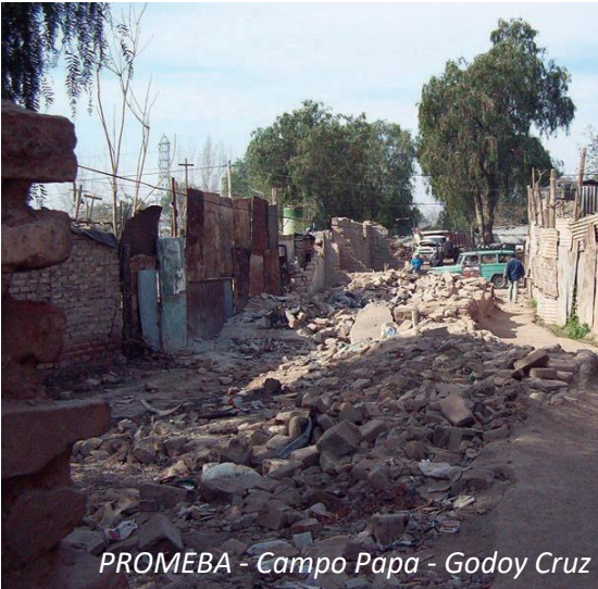
PROMEBA - Campo Papa - Godoy Cruz

Consolidación, acceso a la propiedad de la tierra, provisión de obras de infraestructura urbana, equipamiento comunitario y saneamiento ambiental. Fortalecimiento de su capital humano y social.