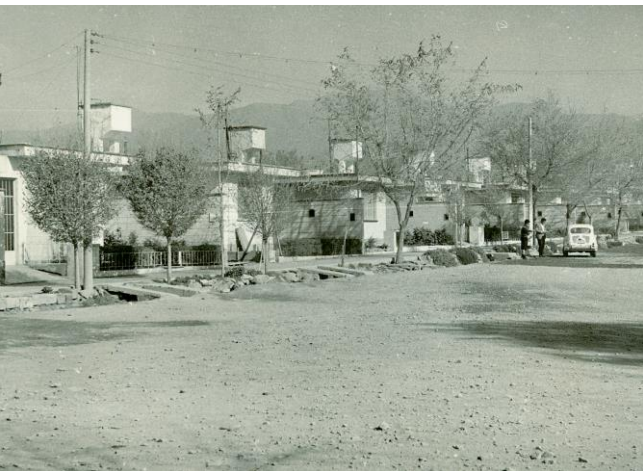
Bº Infanta Mercedes de San Martín - 626 viviendas Año 1967 - LAS HERAS

Sistema de Ayuda Mutua ´60 ´70 las comunidades residentes aportaban la mano de obra. 2504 viv.