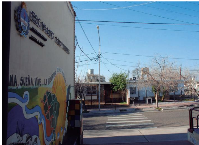
Bº Infanta Mercedes de San Martín - Año 2017 - LAS HERAS

Sistema de Ayuda Mutua ´60 ´70 las comunidades residentes aportaban la mano de obra. 2504 viv.