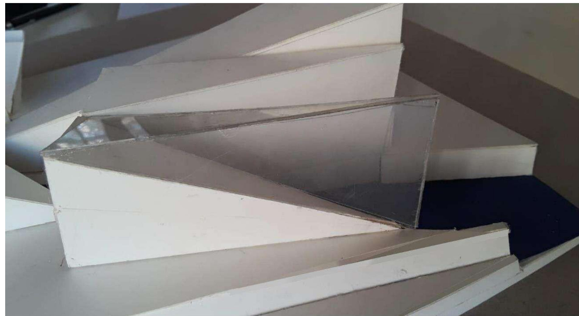
DETALLE 2- TEXTURA VISUAL TACTIL DE PEP