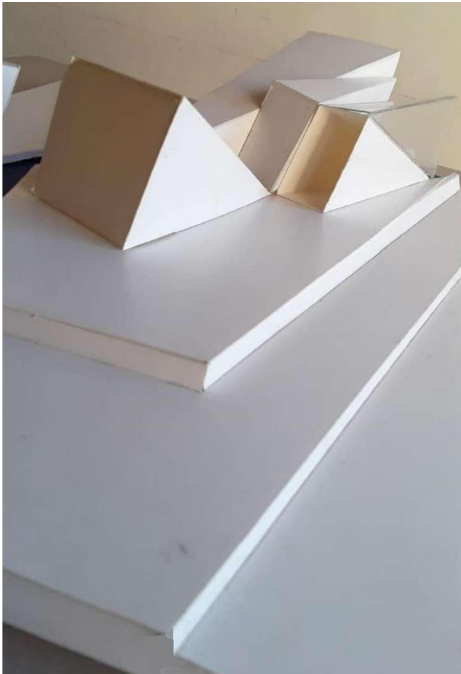
DETALLE 3- ESCALONAMIENTO Y RECUBRIMIENTO DE BASE DE PIRAMIDE CON TEXTURA VISUAL/ TÁCTIL DE PAPEL MANTECA