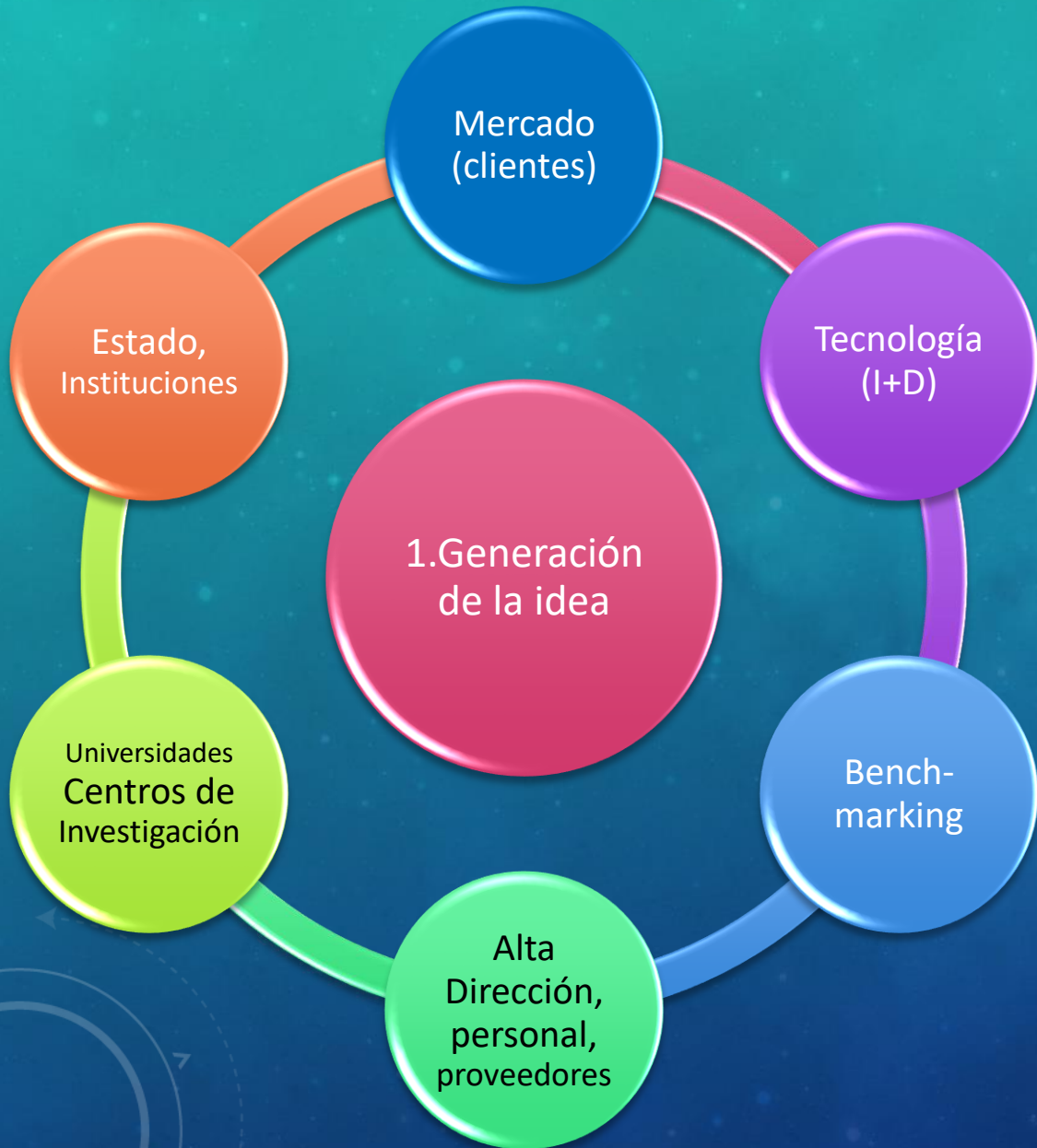
Evolución de ideas vs. desarrollo del proceso