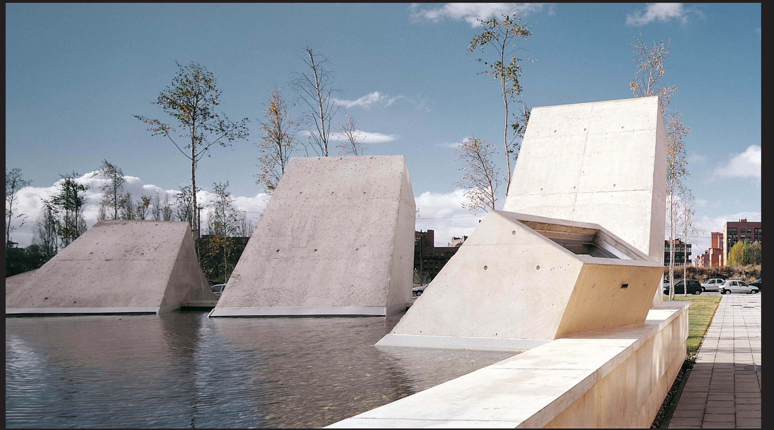
Tanatorio, León Jordi Badía y Josep Val 2001