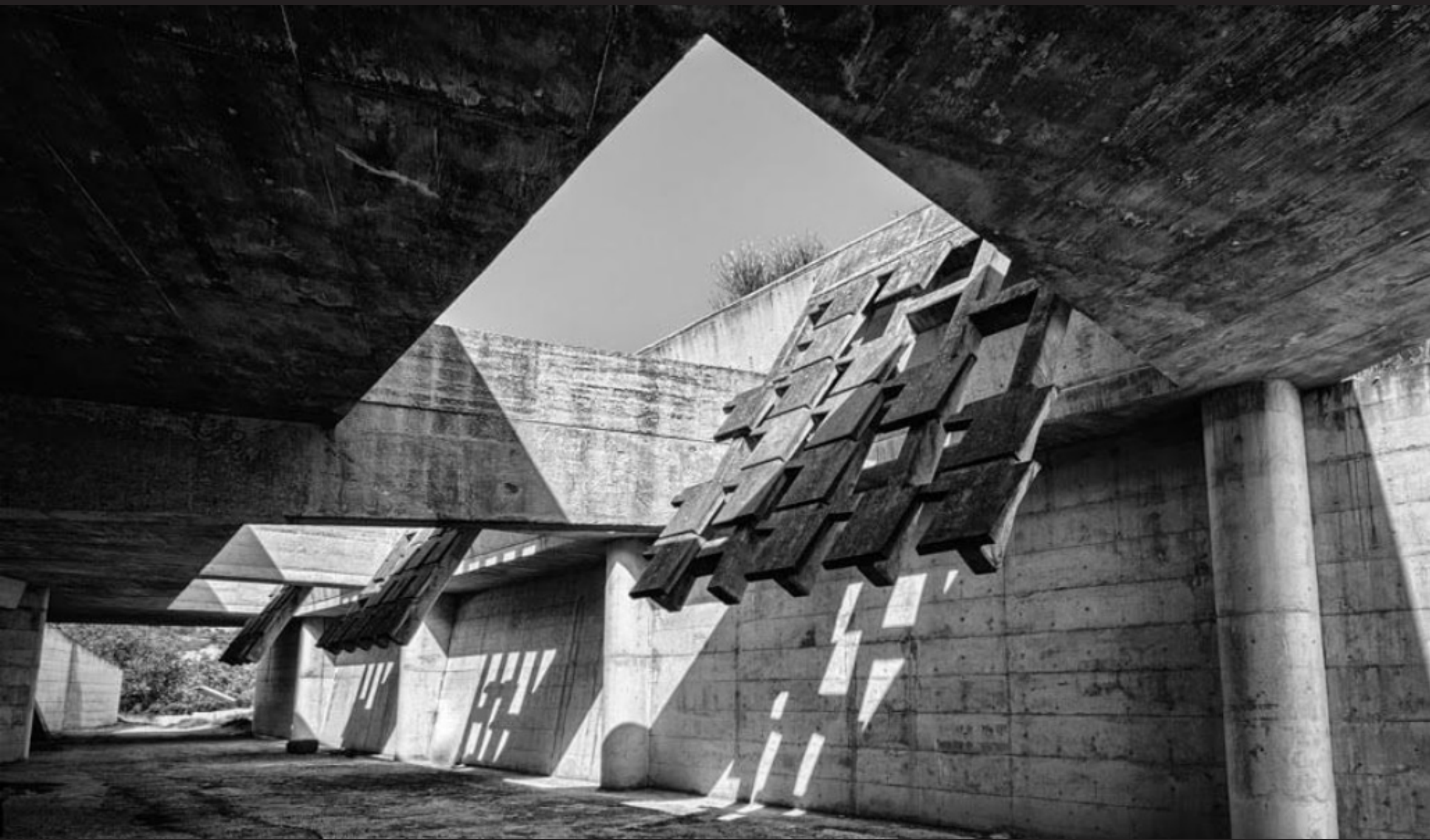
Igualada, Barcelona Enric Miralles 1984