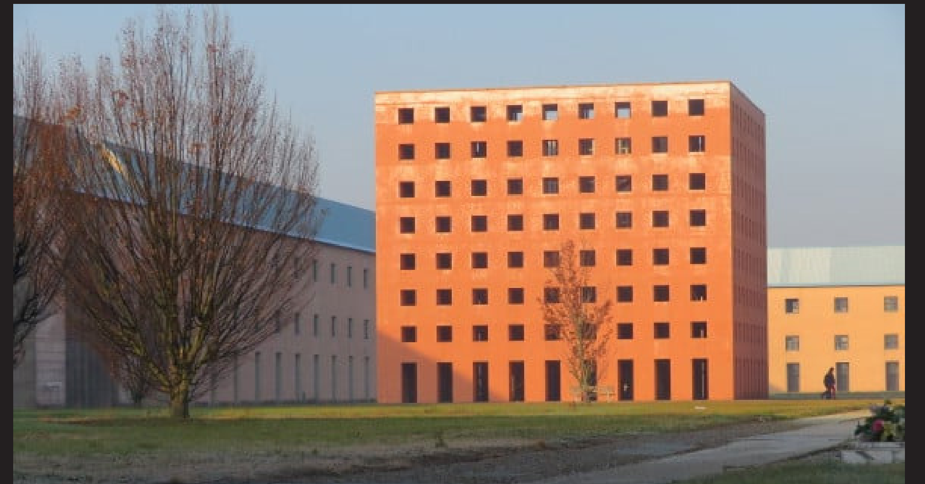
San Cataldo, Módena Aldo Rossi 1972