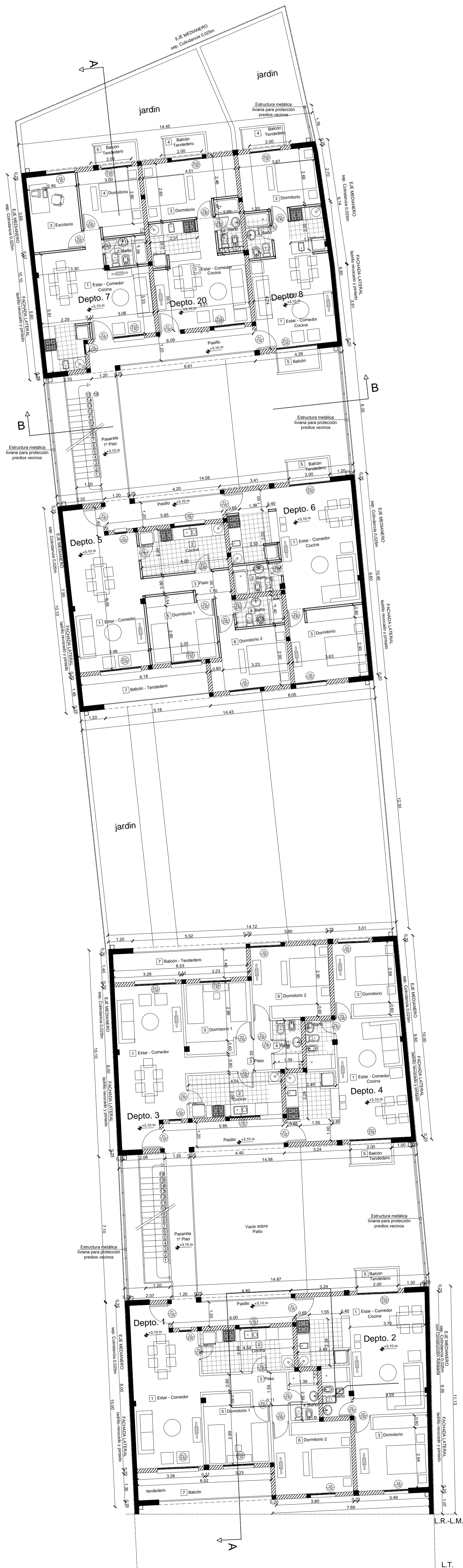
PLANTA 1º PISO