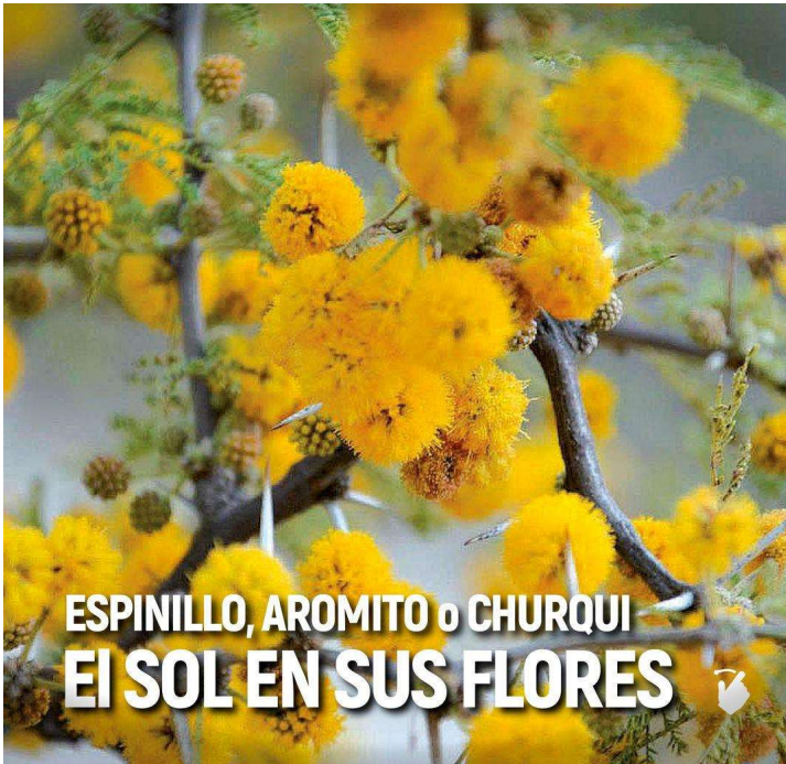
ESPINILLO, AROMITO o CHURQUI EI SOL EN SUS FLORES