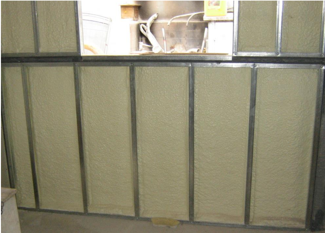
Imagen 6. Aislación con poliuretano proyectado, listo para colocar la otra placa.

Colocación del material aislante en el interior de la pared. Una de las opciones para aislar térmicamente consiste en proyectar espuma de poliuretano sobre la cara interior de una de las placas, llenando el espacio que queda entre ambas placas (dicho espacio será el ancho del montante).