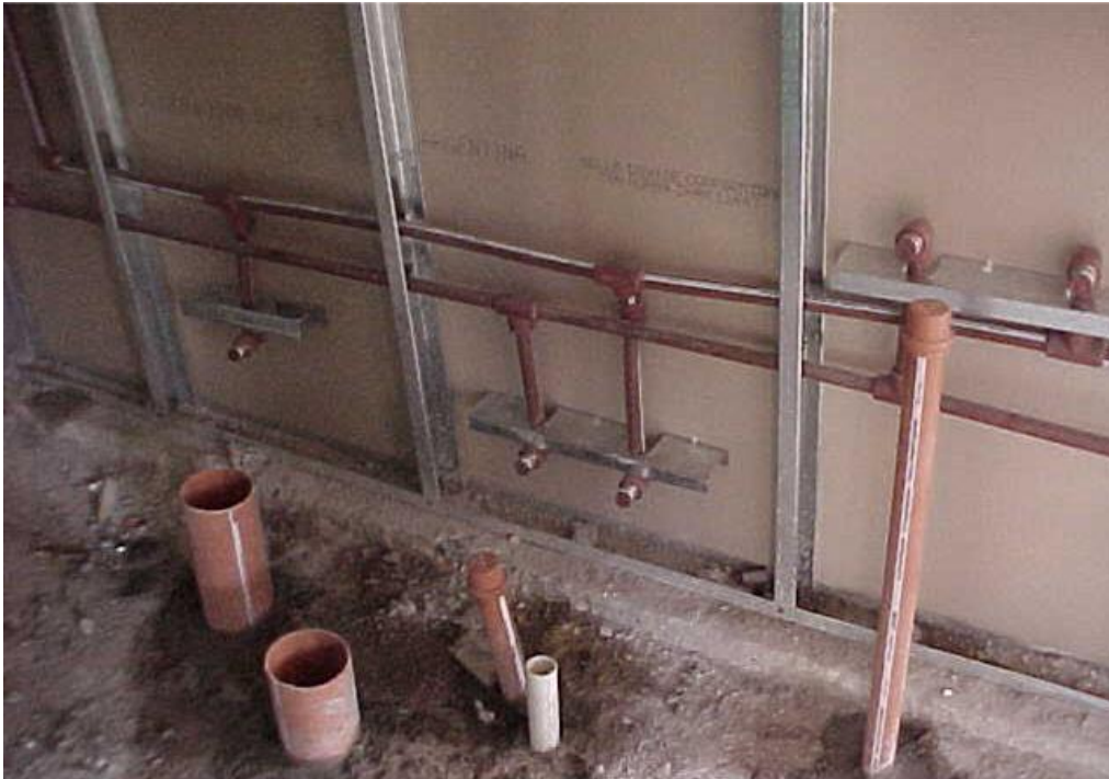
Imagen 4. Pase y fijación de instalaciones de agua fría y caliente.

Realizar, el pasaje de instalaciones. Se coloca un refuerzo para que las cajas de electricidad queden sujetadas y estancas. Para ello se fija una solera a los montantes con tornillos T1, sobre la cual se apoyará la caja que contendrá una terminal eléctrica.