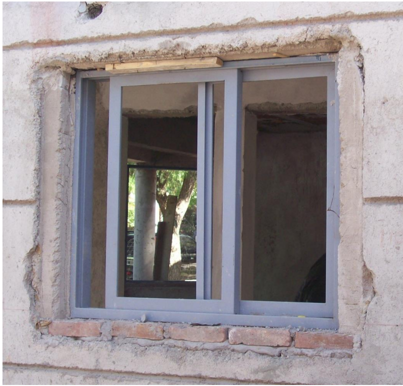
Imagen 14. Colocación de marco metálico.

El marco se coloca con las hojas puestas, ya que le aportan rigidez a la abertura para evitar deformaciones. Luego se debe realizar la apertura de las puertas y ventanas para verificar una correcta colocación.