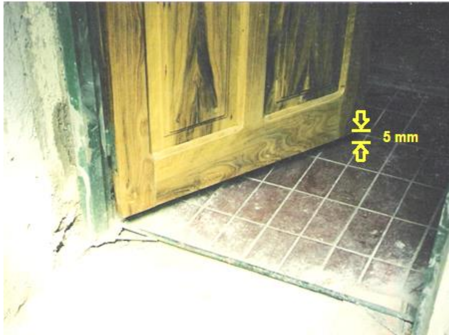
Foto 15. Separación de puertas del Nivel de Piso Terminado. (Observar separación excesiva de 5 cm entre piso y hoja)

Aclaración: este material tiene como objetivo ayudar a la comprensión del alumno de las técnicas y procesos constructivos. NO constituye un único material de estudio , sino que es complementario a los contenidos mínimos de cada tema desarrollados en el libro de la cátedra, debiéndose ampliar con la bibliografía recomendada.