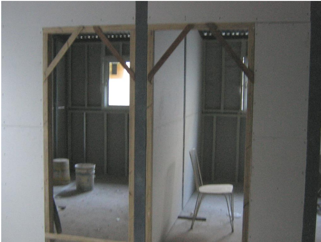
Imagen 7. Colocación de marcos apuntalados provisionarios para la posterior colocación de la abertura.