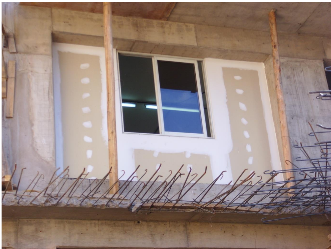
Imagen 8. Tabique de placas de yeso listo para pintar.