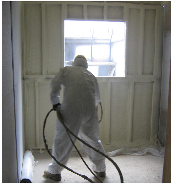
Imagen 5. Aislación del tabique.

El pase de las cañerías horizontales se hará a través de los agujeros que prevén a tal fin los montantes. Para fijar las salidas de agua para los artefactos, se colocan soleras conectadas a los montantes.