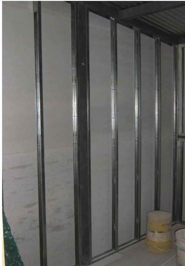
Imagen 2. Colocación de la placa exterior.

Fijar las placas sobre una cara de la estructura, en forma horizontal o vertical, trabando las juntas y separándolas 10 a 15mm del piso. La segunda capa de placas se colocará trabando las juntas respecto a las de la primera capa, utilizando tornillos autorroscantes T3,