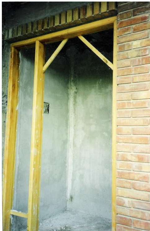
Imagen 12. Colocación de marco de madera.

Se aplica una capa de pintura asfáltica en la cara interna de los marcos que estarán embutidos y en contacto con el muro.