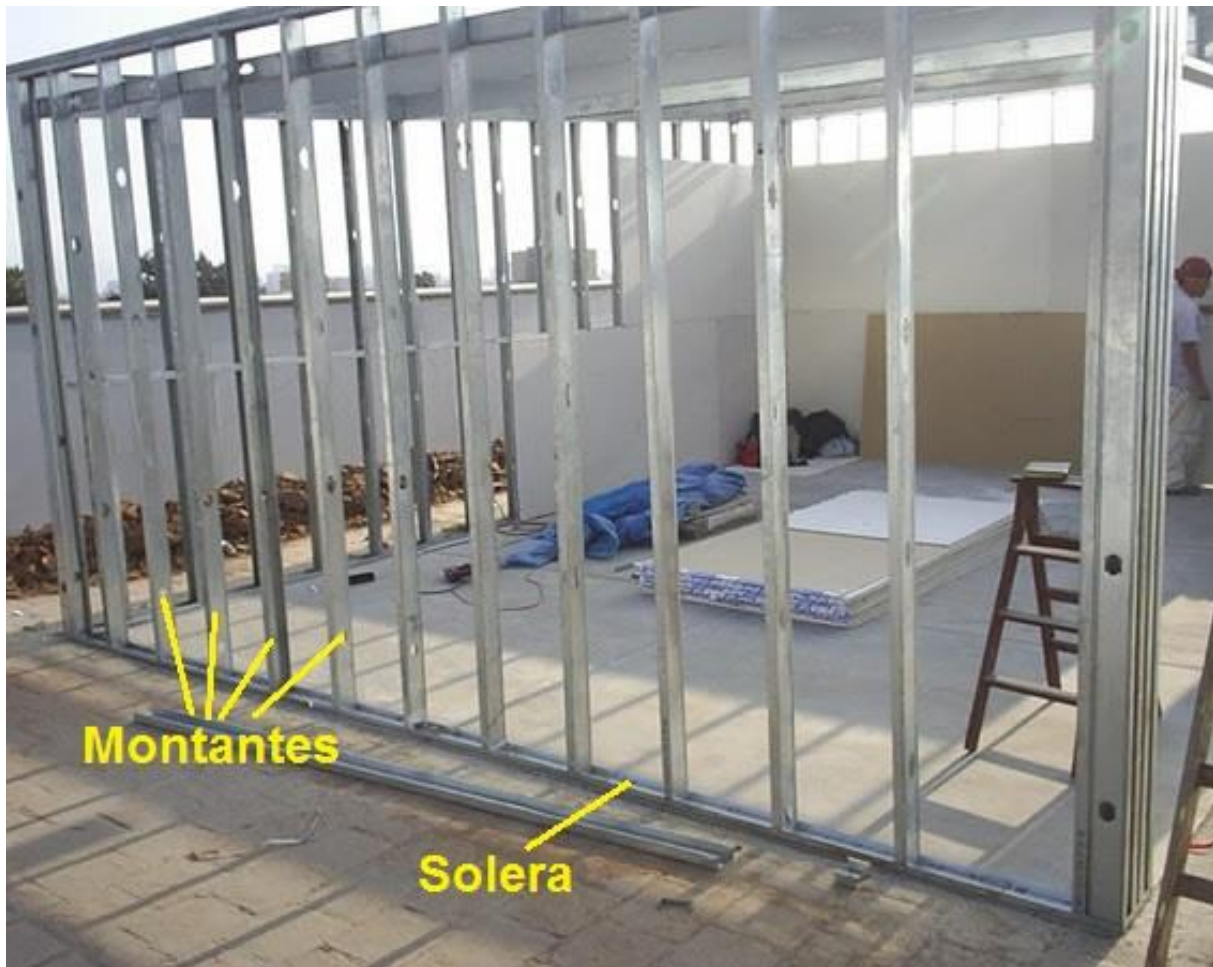
Imagen I. Elementos que conforman la estructura del tabique.

Replantear la posición de la pared utilizando hilo entizado, fijar al piso la Solera inferior, mediante Tarugos de expansión de nylon N° 8 y tornillos de acero de 6mm de diámetro x 40 mm, colocados con una separación máxima de 0,60 m. Fijar luego la Solera superior, trasladando su posición con plomada o nivel laser.