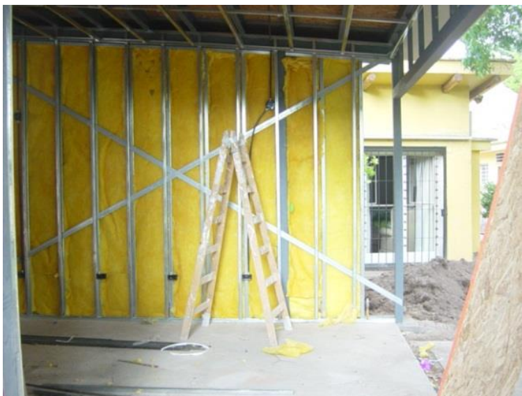
Imagen 7 Aislación con lana de vidrio