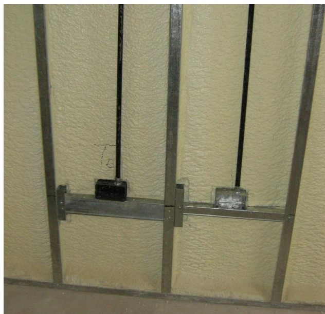
Imagen 3. Colocación de instalaciones eléctricas.

Fijar las placas sobre una cara de la estructura, en forma horizontal o vertical, trabando las juntas y separándolas 10 a 15mm del piso. La segunda capa de placas se colocará trabando las juntas respecto a las de la primera capa, utilizando tornillos autorroscantes T3,