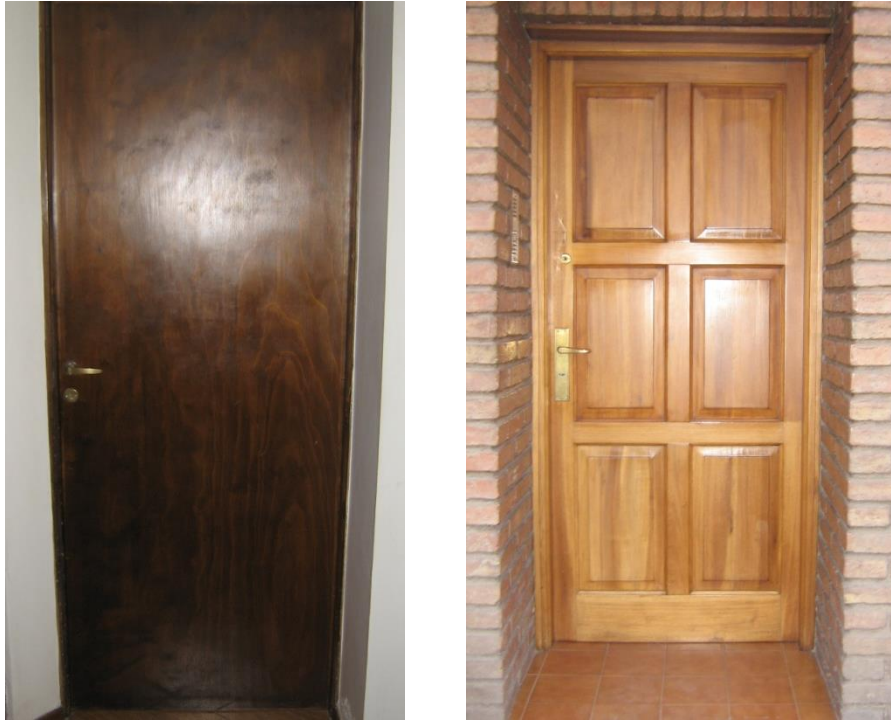
Imagen 9. Puerta placa y puerta tablero.