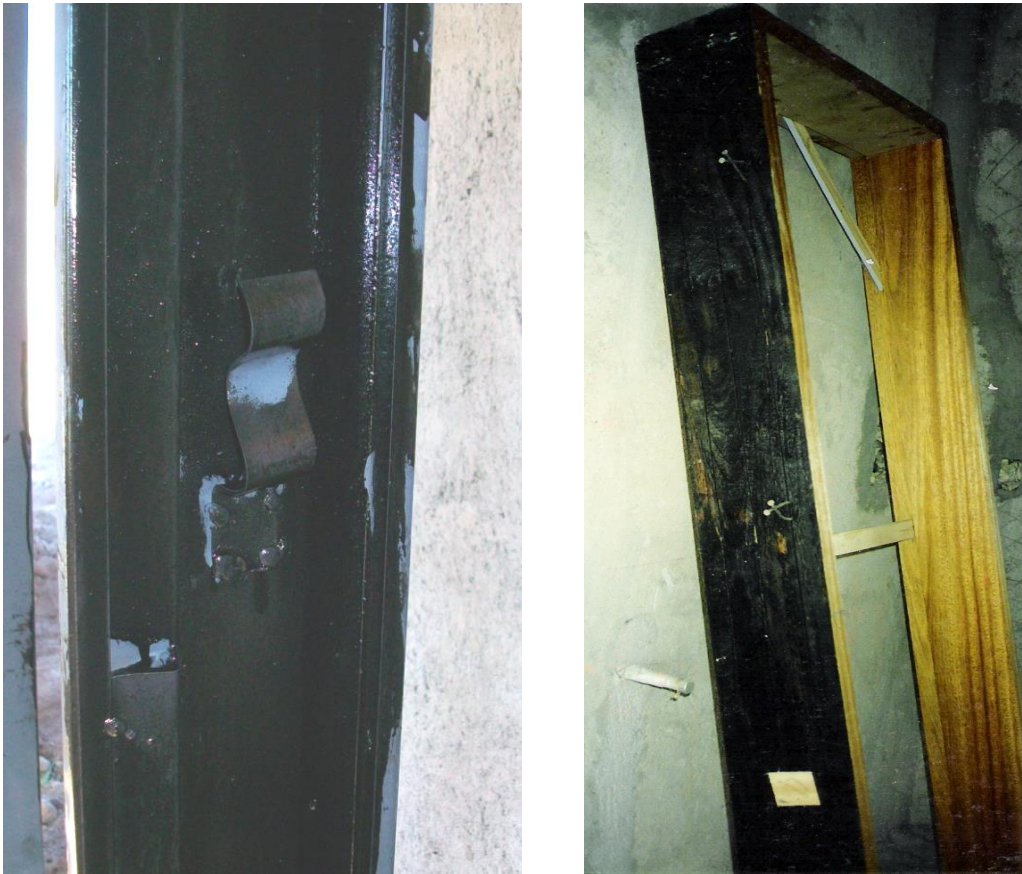
Imagen 11. Protección de marcos metálicos y de madera.

Se aplica una capa de pintura asfáltica en la cara interna de los marcos que estarán embutidos y en contacto con el muro.