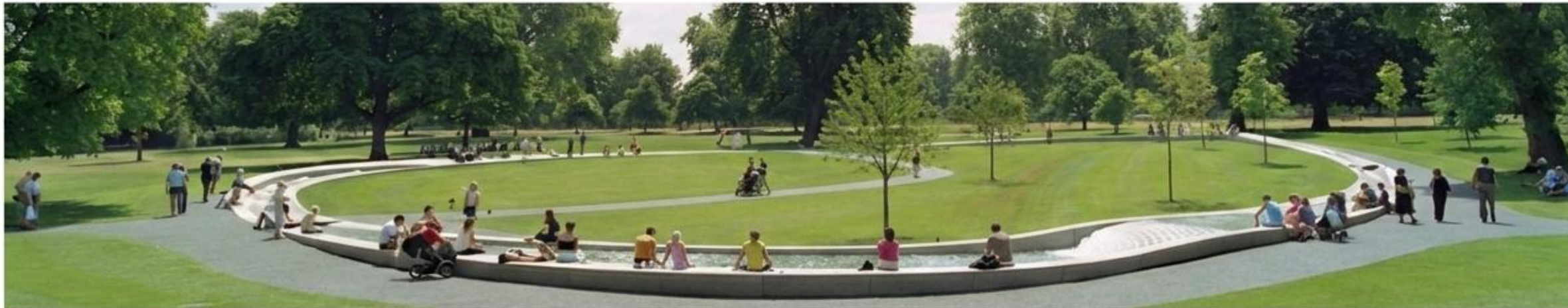
Proyección del resultado final: Integración paisajística y espacio público.

04. Desarrollo: Anteproyecto y proyecto final.