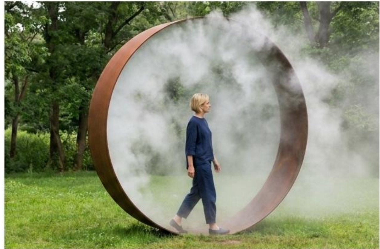
Desmaterialización del límite: la bruma como definidor del espacio arquitectónico.

Relación indisoluble entre cuerpo, agua y recorrido. El espacio no solo se ocupa; se experimenta sensorialmente.