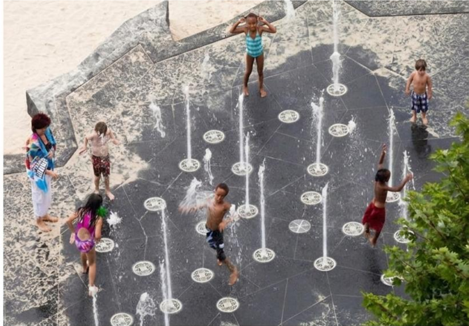
El espacio público como integrador social a través de la interacción táctil.