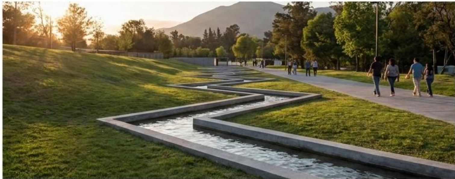
El recorrido del agua como articulador topográfico y direccional.